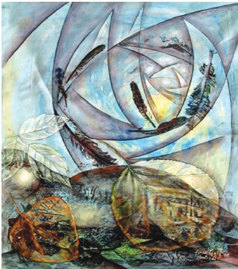
Cortesía de Israel González Rivero

Una noche, en la que se me hacía imposible dormir, fui hasta la cerca. Me senté a valorar las posibilidades reales que teníamos de cruzar y hasta dónde podría ser mentira lo que nos