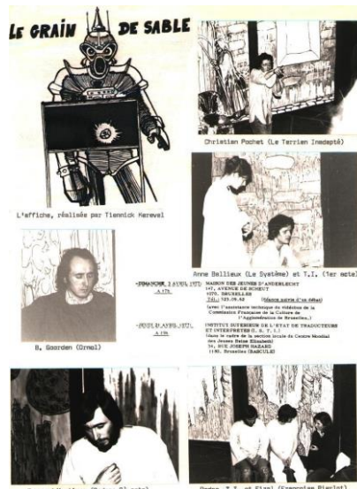
Figura 2. Programa diseñado para el montaje belga de Le grain de sable (1977)