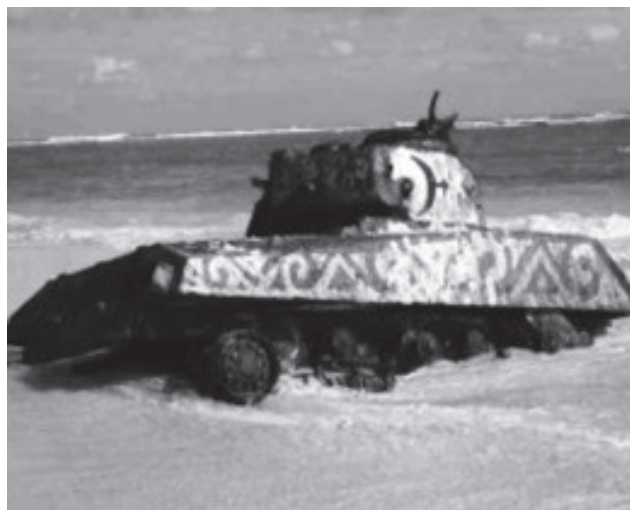
Imagen del filme Culebra: el comienzo