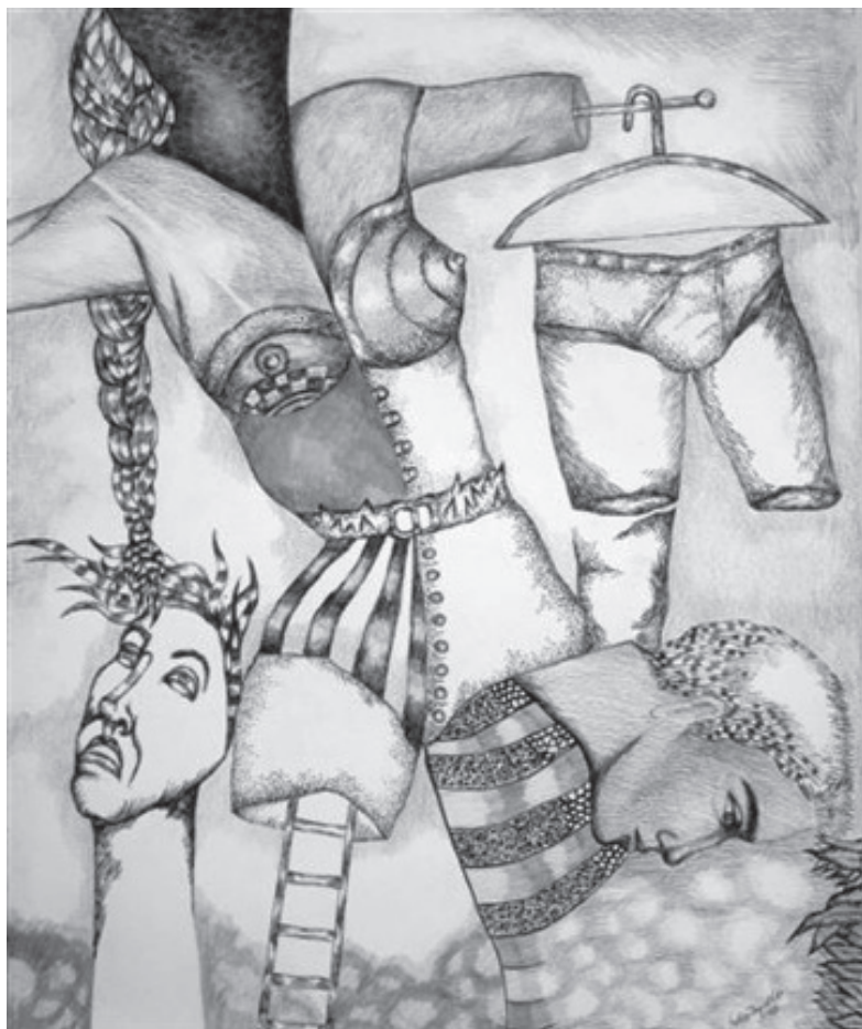
Julio Trujillo, Maniqué con botones

Cuando fue amante de papá era más o menos de mi edad, le recuerdo muy bien Carmen Merengue la volatinera volando de un trapezio a otro bailando la navaja volvedora [...] bailando como si nada le importara si vivía o moría sólo bailar clavada por los reflectores al techo de la carpa [...] aquello no podía ser permitido