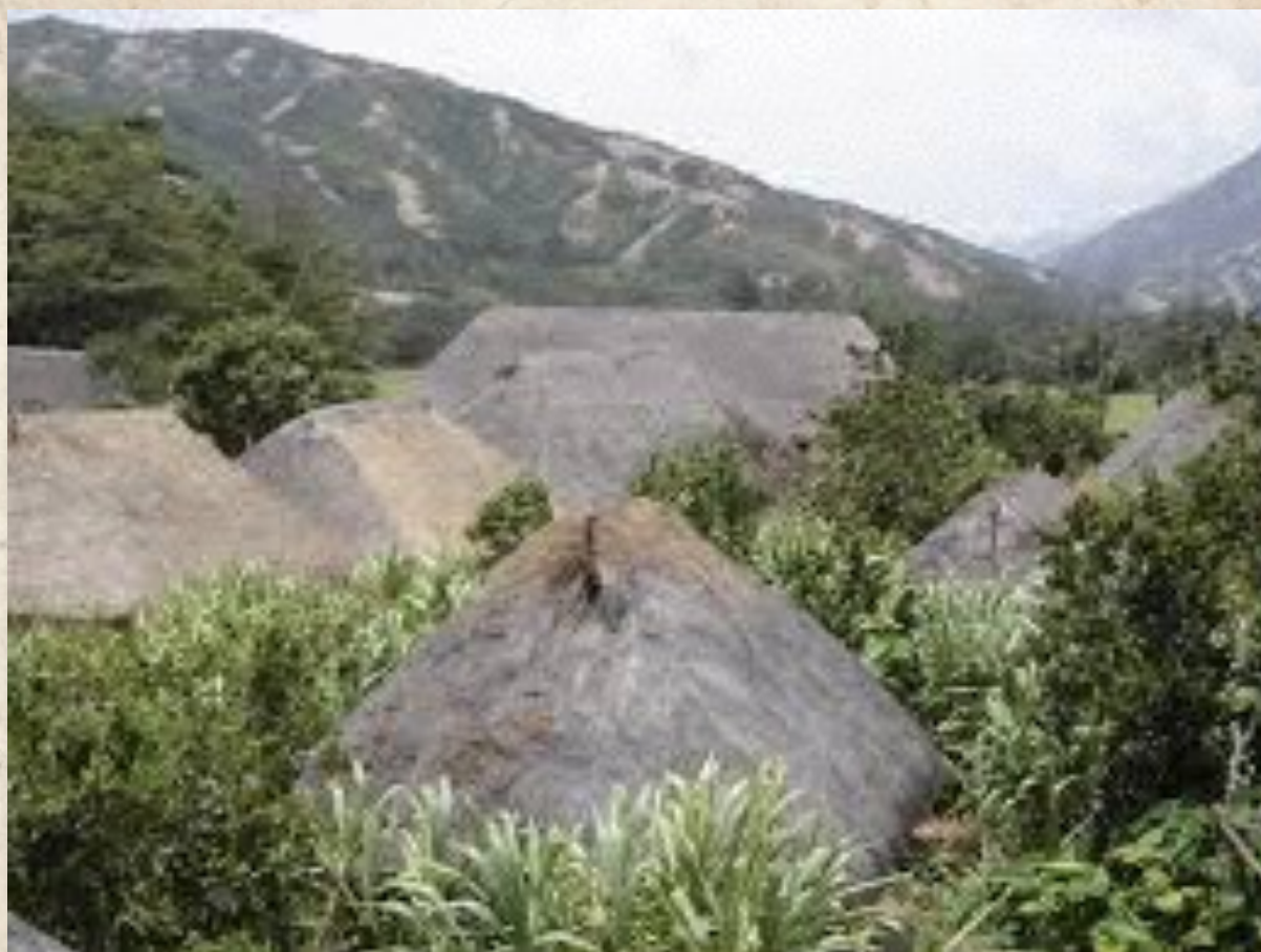
Figura 1: caserío en la Sierra Nevada de Santa Marta.

madre, pero nosotros ya nos estamos olvidando; hay que estudiar el pájaro para recordar y hacer como ellos. (Echavarría, 1993:221)