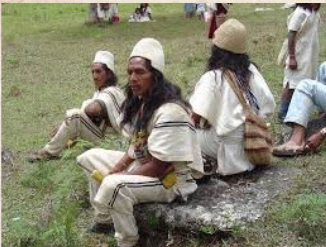
Figura 2: indígenas de la Sierra Nevada de Santa Marta.

Este lugar es el corazón de todos los seres humanos que existimos en todas partes del mundo. (Sánchez Gutiérrez y Molina Echeverri, 2010:76)